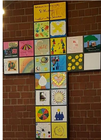
Gemeindekreuz aus gestalteten Kacheln der Gremien, Gruppen und Kreise

Spendenkonto: Frankfurter Volksbank IBAN: DE 73 5019 0000 6200 1867 27 BIC: FFVBDEFF